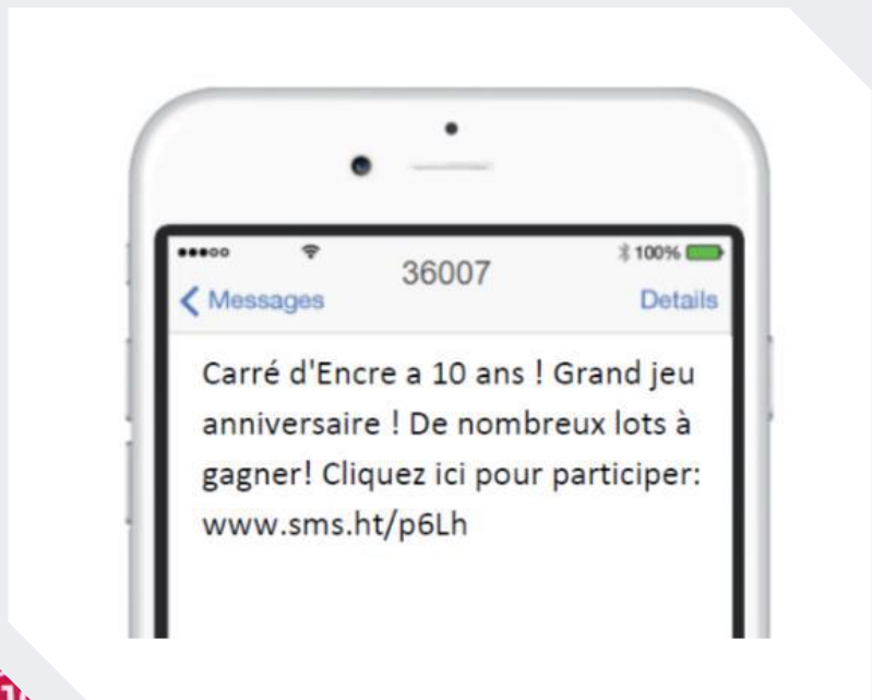
Relais de l'évènement par SMS