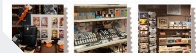
Relais de l'évènement par email